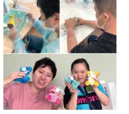
っていたです。 現在、ぱうらはつどいに向けて自主製 <sup>ひん せいさく と く</sup> ことし 品の制作に取り組んでいます。今年の いちぉ はながみ つく 一押しはお花紙で作った「くまちゃん <sup>めもくりっぷっ</sup> (メモクリップ付き)」。他にも、空き かん り m い くかん to to せい 缶でリメイク缶づくりなど楽しんで制 今津 優子 作しています!