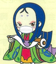
宇治市宣伝大使 ちはや姫